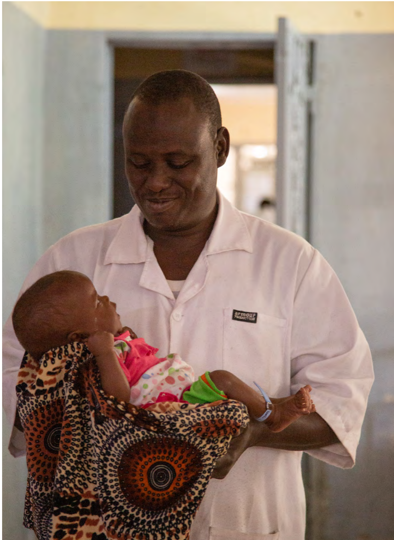
↑ In de stad Massakory werkt Artsen zonder Grenzen samen met het ministerie van Volksgezondheid om medische zorg te bieden aan de gemeenschap rond het ziekenhuis. We behandelen onder andere kinderen voor ernstige acute ondervoeding. Tsjaad, januari 2024.